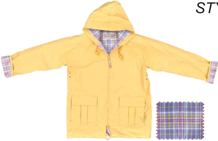
YELLOW / JAUNE