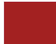
RED / ROUGE