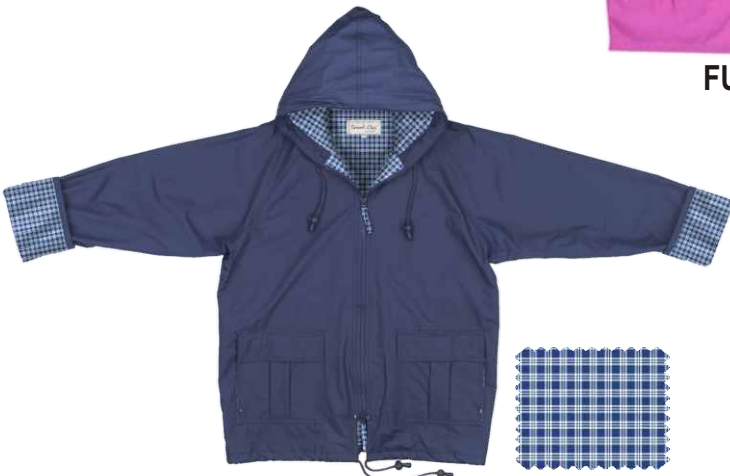
NAVY / BLEU MARINE