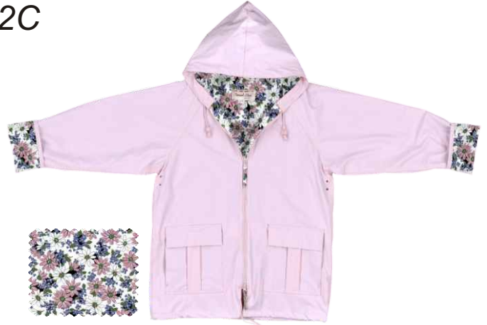
PINK / ROSE