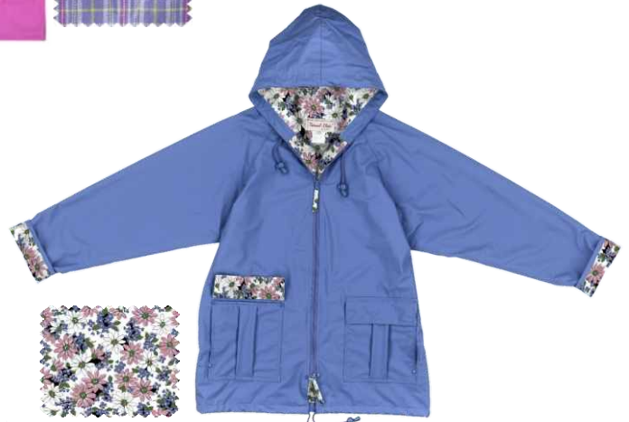
PERI / PERVENCHE